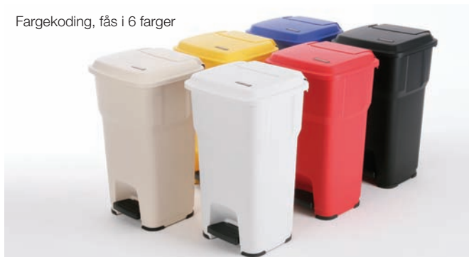
Fargekoding, fås i 6 farger