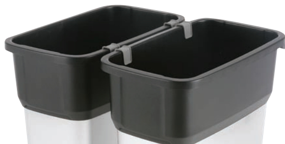
Integrert ergonomisk håndtak