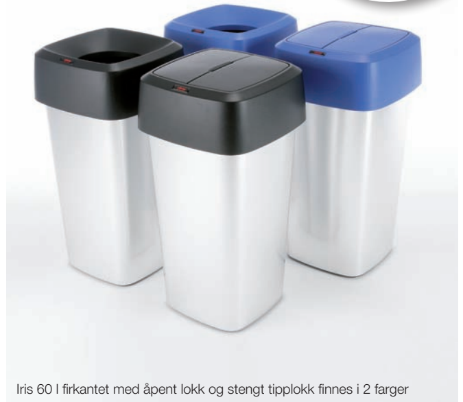
Iris 60 l firkantet med åpent løkk og stengt tippeløkk finnes i 2 farger