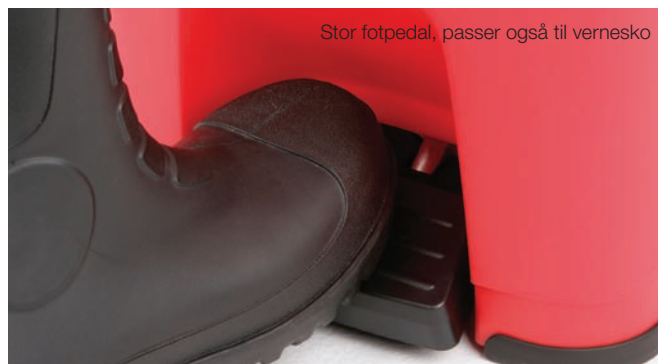
Stor fotpedal, passer også til vernesko