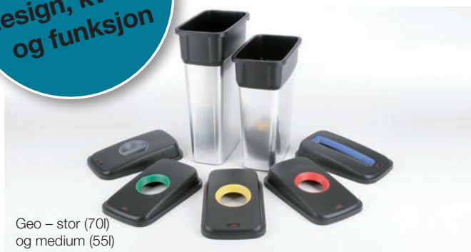
Geo – stor (70l) og medium (55l)

Førsteklasses design, kvalitet og funksjon