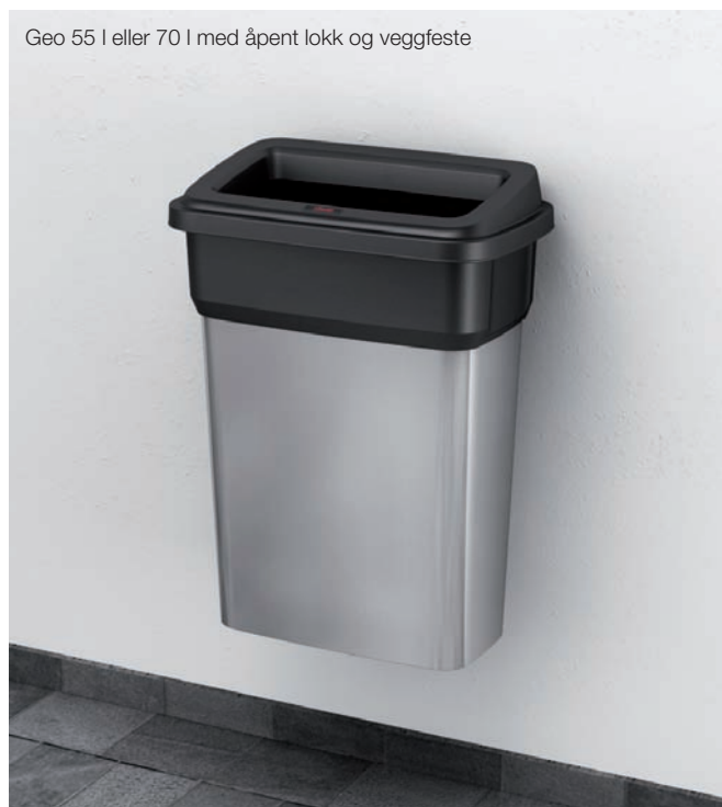
Geo 55 l eller 70 l med åpent lokk og veggfeste