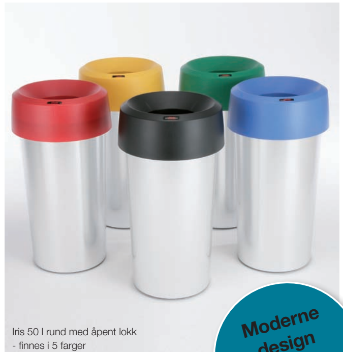
Iris 50 l rund med åpent løkk - finnes i 5 farger