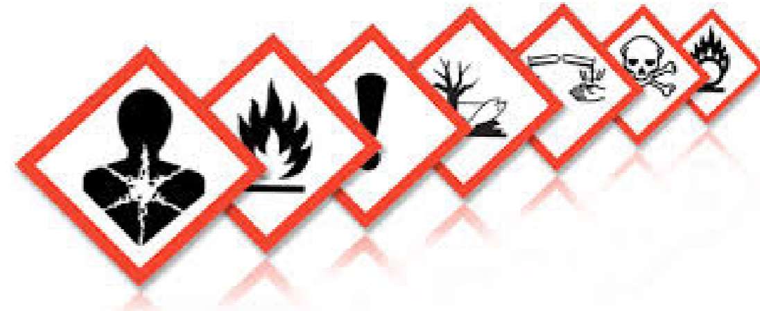
Bildetekst: De nye piktogrammene fungerer parallelt med de gamle - orange og svarte - fram til 2015.

Merking, sproring og kontroll satt i system – www.act-gruppen.com