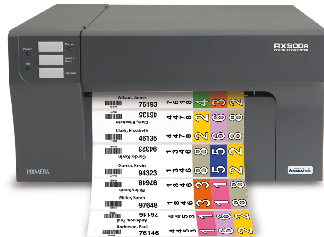
Bildetekst: ACT Logimark er forhandler av Primera etikettprintere i Skandinavia. Det finnes mange modeller, tilpasset ulike volum. Snakk med ACT for å diskutere om blekkstrålemerking eller etiketter er det riktige valget for din bedrift.